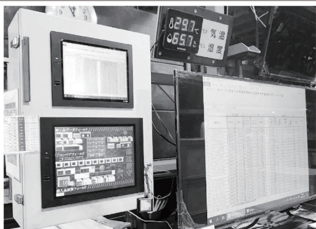
新システムと自動記録システム

「made in Japan」の復活に期待を寄せる高良社長。品質向上に賭ける思いを聞くと、「我々は常に自動車メーカーからの厳しい要件に対応している。当然ながら提供する製品にバラつきがあるのはならない。不良品が出てから反省するのでは